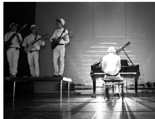
De Grote Avond