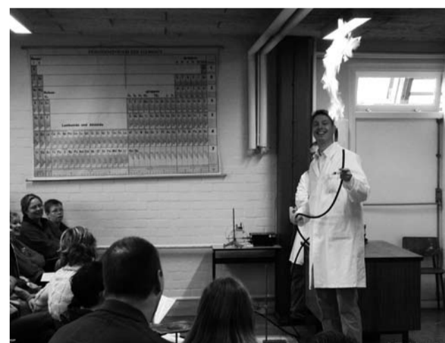
De Open dag